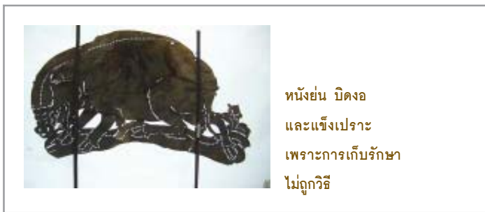
หนังย่น บิดงอ และแข็งเปราะ เพราะการเก็บรักษา ไม่ถูกวิธี

ถ้าห้องเก็บหนังสกปรกรกรุงรังก็จะต้องระวังศัตรูสำคัญของหนังอีกชนิดหนึ่งคือ หนูและแมลง โดยเฉพาะหนังที่ไม่ผ่านการฟอกเป็นอาหารที่แสนอร่อยของสัตว์ประเภทนี้ และทำให้เกิดรอยกัดแทะที่แก้ไขได้ยาก นอกจากนี้หมาและแมวก็ชอบกินหนังอีกด้วย เพื่อนของป่าเม้าท์เล่าให้ฟังว่าผลอวางตัวหนังตะลุงไว้หน้าบ้าน พอออกมาหนังเกือบครึ่งตัวก็เข้าไปอยู่ในท้องหมาเสียแล้ว