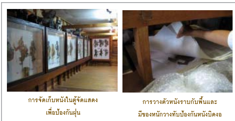
การจัดเก็บหนังในตู้จัดแสดง เพื่อป้องกันฝุ่น