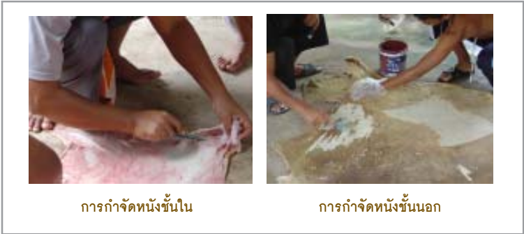
การก้าจัดหน้กัันชั้นใน