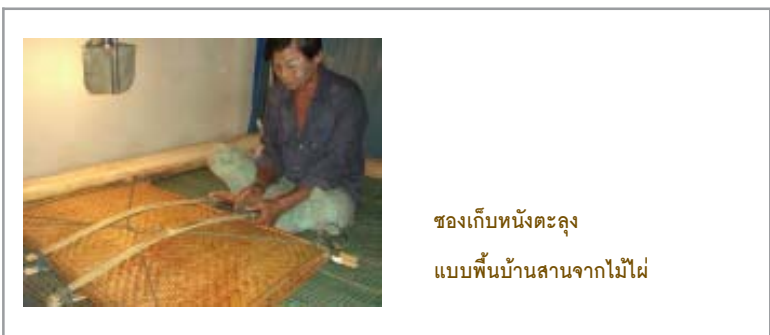
ซองเก็บหนังตะลุ แบบพื้นบ้านสานจากไม้ไผ่

หนังที่บิดงอ มีวิธีการแก้ไขด้วยการปัดฝุ่น ทำความสะอาดด้วย แปรงขนอ่อน หลังจากนั้น เช็ดด้วยแอลกอฮอล์ 50 % ปล่อยให้แห้ง แล้วเช็ดด้วย แอลกอฮอล์ผสมกับน้ำมันละหุ่ง ทาซ้ำหลายๆ ครั้งด้วยน้ำมันละหุ่ง เมื่อหนังนุ่ม ลงแล้ว หาของหนักๆ ทับหนังไว้จนกว่าหนังจะคืนสภาพ (ก่อนทับควรรใช้กระดาษ ประกบหนังทั้ง 2 ด้านก่อน)