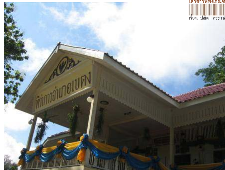
เล่าชาวพิพิธภัณฑ์ เรื่อง: ปณิตา สรวาลี