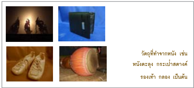
วัตถุที่ทำจากหน้กััน เช่น หน้กัันตะลุง กระเป้าสดางค์ รองเท้า กลอง เป็นต้น

ท่านผู้รู้เขียนบอกไว้ในหนังสือว่ามนุษย์เรานำหน้กัันสัตว์มาใช้ตั้งแต่เมื่อกว่า 5,000 ปีมาแล้ว สมัยแรกๆ หน้กัันสัตว์ถูกนำมาเป็นเครื่องนุ่งห่ม รองเท้า ภาชนะใส่หน้า้ ทำใบเรือ เต็นท์ เฟอร์นิเจอร์ เครื่องประดับฯลฯ ในวัฒนธรรมกรีก โรมัน และฮีบรู หน้กัันถูกนำมาใช้แทนกระดาษและเป็นม้วนหนังสือ ส่วนในแถบเอเชียตะวันออกเฉียงใต้ หน้กัันถูกนำมาใช้ในพื้นที่ยี่ของมหรสพและความบันเทิง นั่นคือ หน้กัันตะลุง และหน้กัันใหญ่ ซึ่งหน้กัันที่นำมาใช้มักเป็นหน้กัันวัว