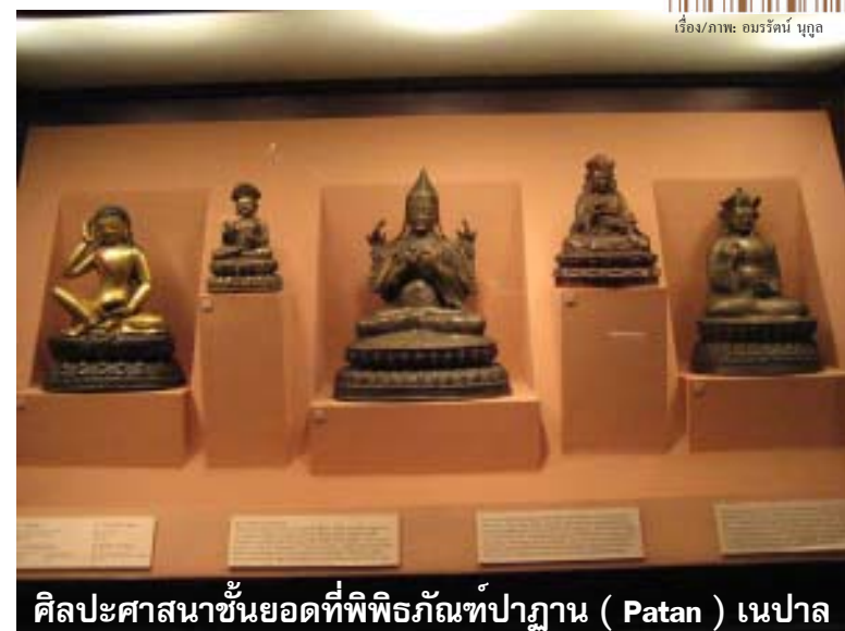
ศิลปะศาสนาชั้นยอดที่พิพิธภัณฑ์ปาฏาน (Patan) เนปาล

เนปาล เป็นประเทศที่อยู่กึ่งกลางระหว่างสองประเทศอารยธรรมใหญ่คือ จีนและอินเดีย ประวัติศาสตร์เนปาลเกิดขึ้นในหุบเขากาฐมัณฑุ (Kathmandu Valley) แสดงถึงทั้งความรุ่งเรืองและความล่มสลายของราชวงศ์ต่างๆ แม้เนปาลจะเป็นประเทศเล็กๆ ที่อยู่ระหว่างสองอารยธรรมใหญ่ แต่ก็มีรูปแบบวัฒนธรรมเฉพาะตนเอง วัฒนธรรมเนปาลเจริญสูงสุดในราชวงศ์มัลละ (ค.ศ. 1200 - 1769) กษัตริย์มัลละที่นำเนปาลไปสู่การเป็นหนึ่งในชาติที่เจริญและเข้มแข็งในเอเชียในปลายศตวรรษที่ 14 คือ พระเจ้าจยสตีตี มัลละ (Jayasthiti Malla)