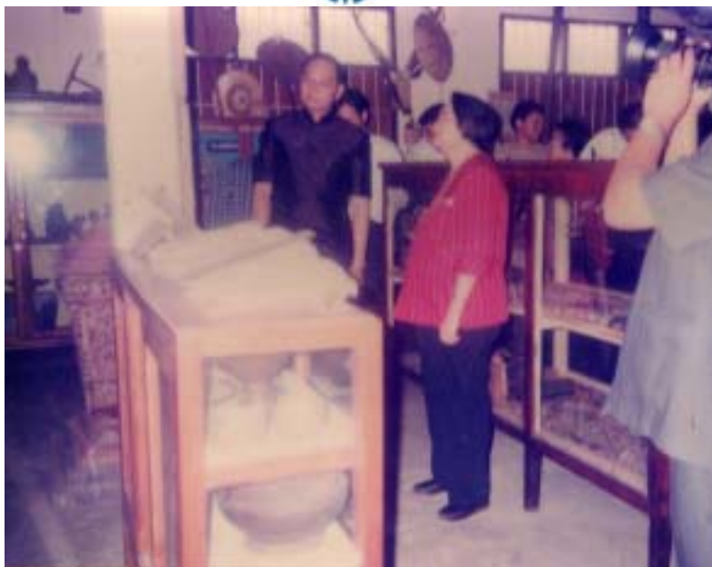
ภาพเมื่อครั้งเสด็จพิธีภัณฑวัดโหลหินหลวง เมื่อวันที่ 13 มีนาคม 2542