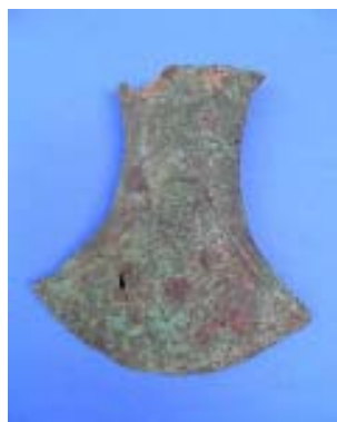
ลักษณะของสนิมที่ช่วยรักษาพื้นผิวของโลหะวัตถุ ตัวอย่างเครื่องมือสำริดจากแหล่งโบราณคดีบ้านโคกคอน จังหวัดสกลนคร

นอกจากนั้น ในภาพรวมแล้วการจัดเก็บโลหะวัตถุไม่ว่าจะอยู่ในพื้นที่จัดแสดงหรืออยู่ภายในคลัง ควรรักษาสภาพแวดล้อมโดยรอบวัตถุให้แห้งที่สุดเท่าที่จะสามารถทำได้ โดยเฉพาะโลหะที่เป็นโบราณวัตถุควรได้รับการจัดเก็บในสภาพที่สามารถควบคุมความชื้นได้ ทั้งนี้ หากมีงบประมาณเพียงพอควรติดตั้งเครื่องมือตรวจวัดความชื้นในบรรยากาศ เพื่อติดตามและรักษาระดับความชื้นในพื้นที่จัดเก็บวัตถุให้อยู่ในระดับที่เหมาะสม คือความชื้นสัมพัทธ์ประมาณ 30 เปอร์เซ็นต์ อย่างไรก็ตาม กรณีของประเทศไทยซึ่งตั้งอยู่ในเขตที่มีภูมิอากาศแบบร้อนชื้นใกล้เส้นศูนย์สูตรนั้น นับว่าเป็นเรื่องยากที่จะควบคุมระดับความชื้นในสภาวะเปิดโล่งให้อยู่ในระดับต่ำได้ แต่มีผลการทดลองยืนยันว่าการจัดเก็บโลหะวัตถุที่บรรยากาศแบบเปิดโล่ง ซึ่งมีความชื้นสัมพัทธ์ประมาณ 55 เปอร์เซ็นต์ก็สามารถจัดเก็บหรือจัดแสดงโลหะวัตถุได้โดยไม่เกิดสนิม